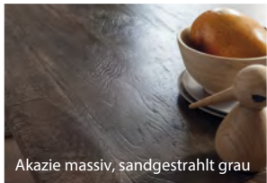
Akazie massiv, sandgestrahlt grau