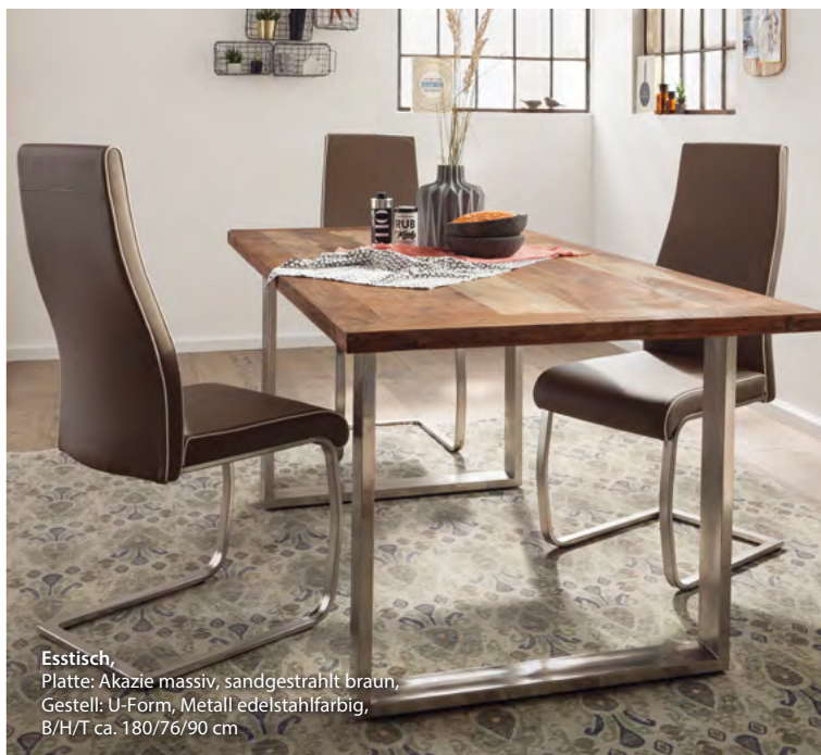
Esstisch, Platte: Akazie massiv, sandgestrahlt braun, Gestell: U-Form, Metall edelstahlfarbig, B/H/T ca. 180/76/90 cm