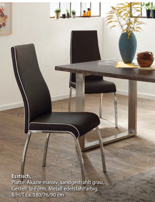
Esstisch, Platte: Akazie massiv, sandgestrahlt grau, Gestell: U-Form, Metall edelstahlfarbig, B/H/T ca. 180/76/90 cm