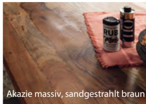
Akazie massiv, sandgestrahlt braun

Die drei spannenden Ausführungen der Tischplatten in sandgetrahlt weiß, braun oder grau bieten für jeden Einrichtungsgeschmack die richtige Grundlage. Und ob die offene U-Form des Tischgestells besser gefällt oder doch lieber die etwas verspieltere A-Form - die standfeste Basis für ein gemütliches Zusammensein im Freundeskreis ist gegeben!