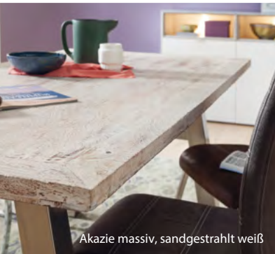
Akazie massiv, sandgestrahlt weiß