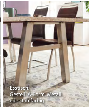
Esstisch, Gestell: A-Form, Metall edelstahlfarbig